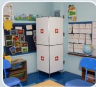
Sistemas de filtración de aire