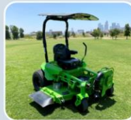
Jardinería de emisión cero para escuelas