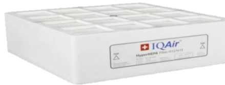
Sistemas de filtración y purificación de aire