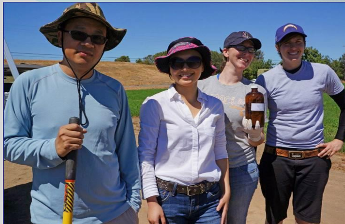
Monitoreo de aguas superficiales