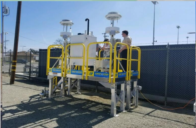
Monitoreo del Aire