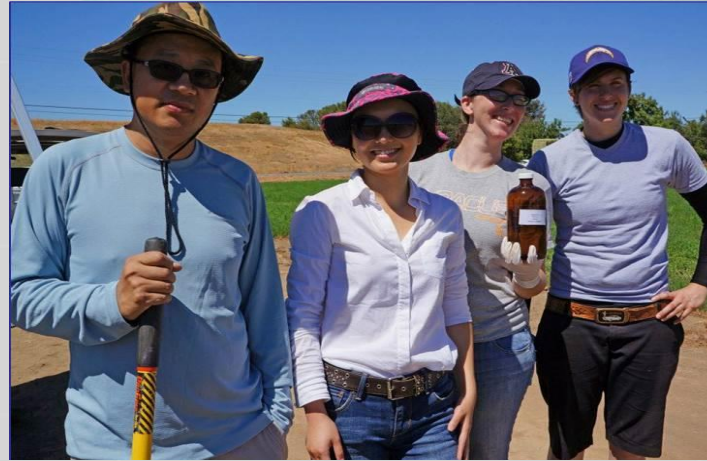
Surface water monitoring