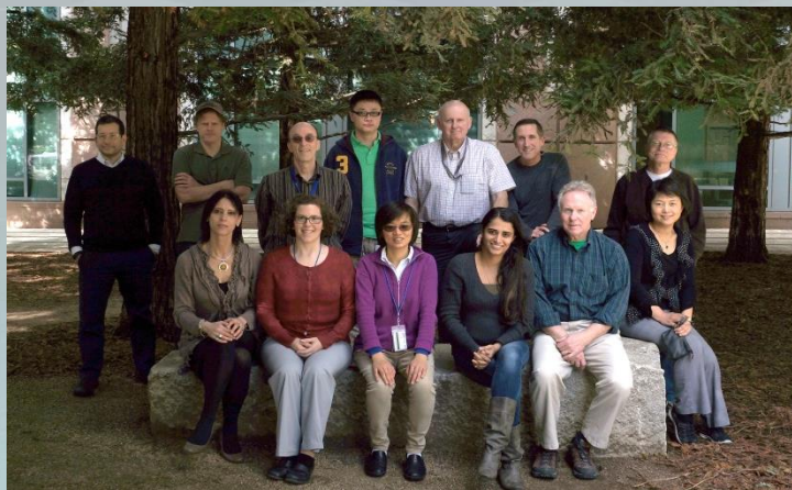
Evaluación de la Salud Humana