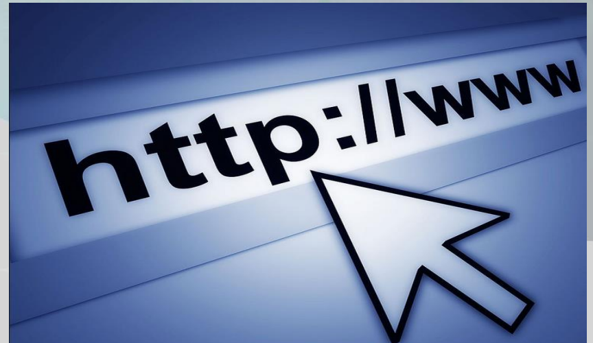
Unregistered products sold online