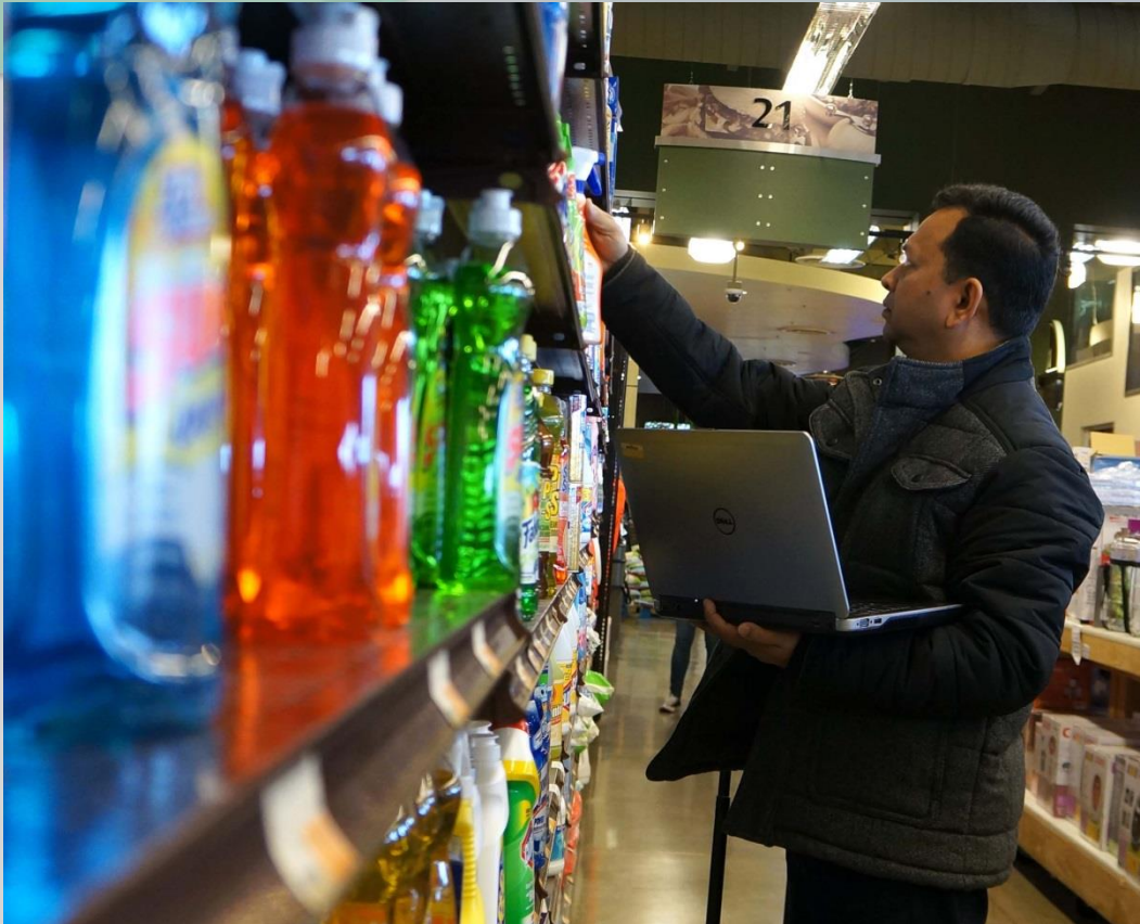
DPR scientists inspect stores statewide looking for unregistered products