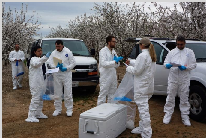
Pruebas (muestras) de Campo