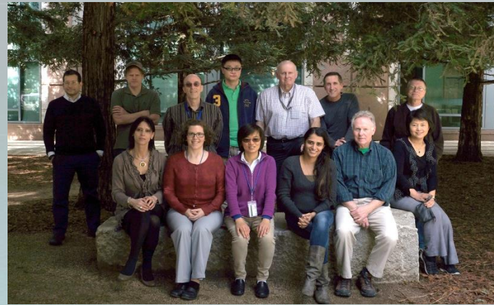
Human Health Assessment