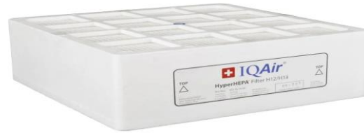
Sistemas de Filtración de Aire/Purificadores de Casas