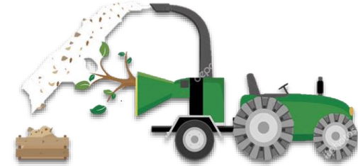
Alternativas a la quema agrícola al aire libre