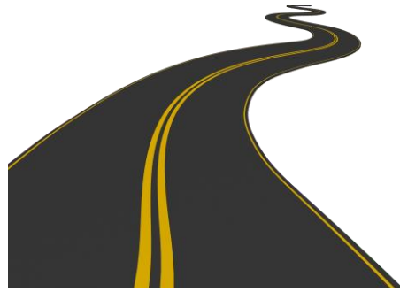
Pavimentación de carreteras