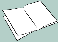
manual de usuario