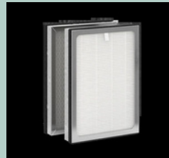
filtro de repuesto*

*El suministro de filtros para tres años puede llegar en un envío separado