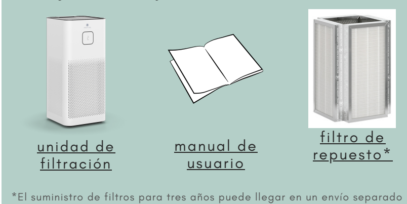
unidad de filtración