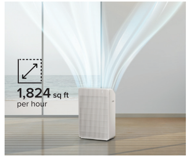
LARGE COVERAGE Reaching up to 1,824 sq.ft. the air in your children's room, home office, kitchen or bedroom wii be effortlessly purified