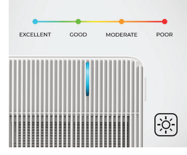
AIR QUALITY INDICATOR Detects the surrounding real-time air quality and with AUTO mode initiated, will automatically adjust the fan speed