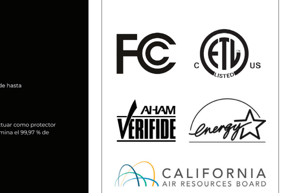
TABLA DE ESPECIFICACIONES